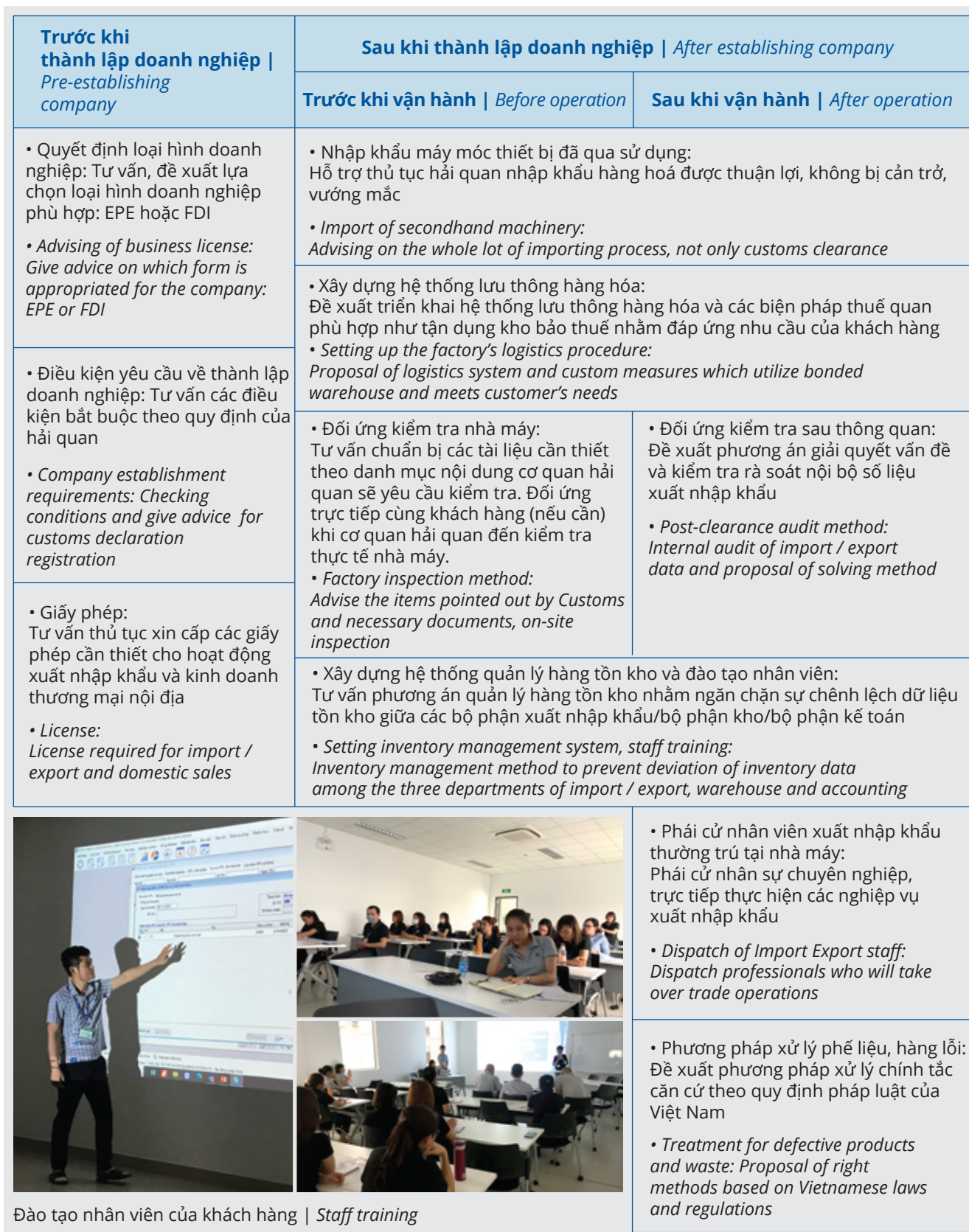
Đào tạo nhân viên của khách hàng | Staff training

Utilizing our abundant experience to support and propose the most appropriated procedure for our customers.